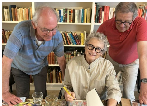
Uitgewer: Protea Boekhuis Nicol Stassen